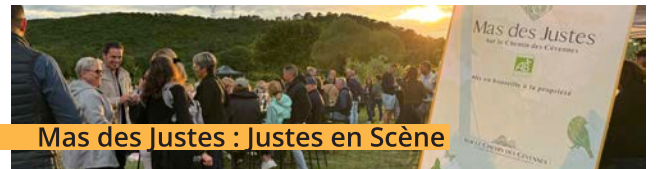
Mas des Justes : Justes en Scène

200 participants pour cette soirée festive et musicale version Rolling Stone !